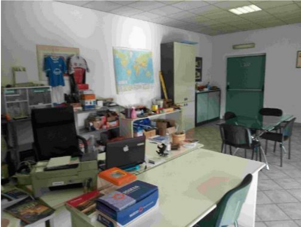
Foto 20 ufficio con apertura su sala riunioni