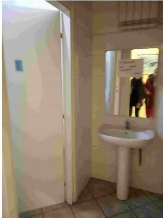
Foto 22 locale deposito uffici